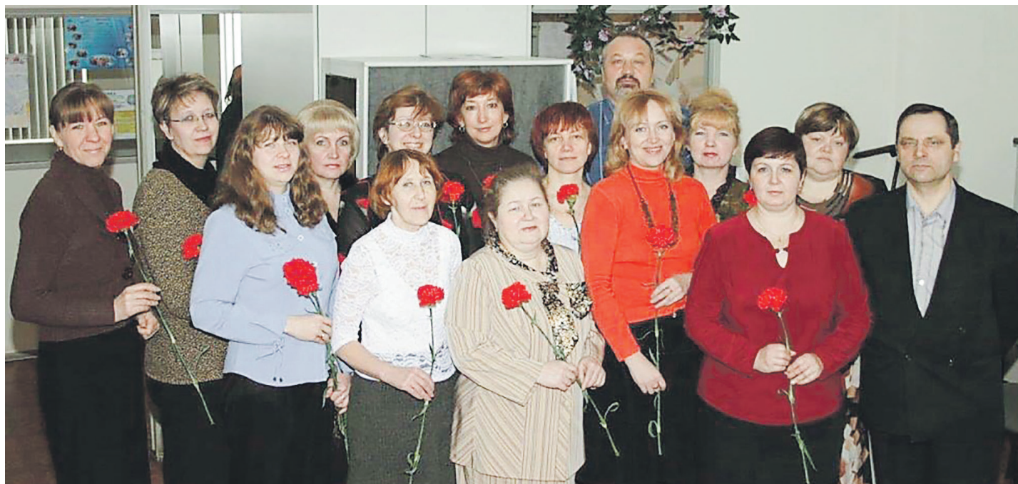
Отдел АСУП ДИТ. Общее фото в честь Международного женского дня 8 Марта, 2006 год

Беседовала Надежда Исмаилова