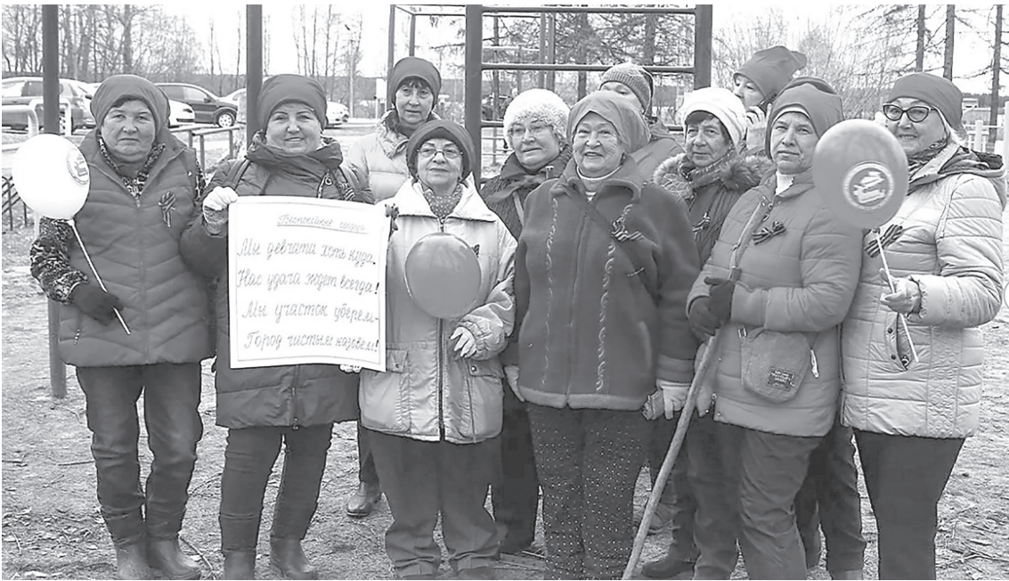
Команда ветеранов картонно-бумажного производства «Беспокойные сердца»