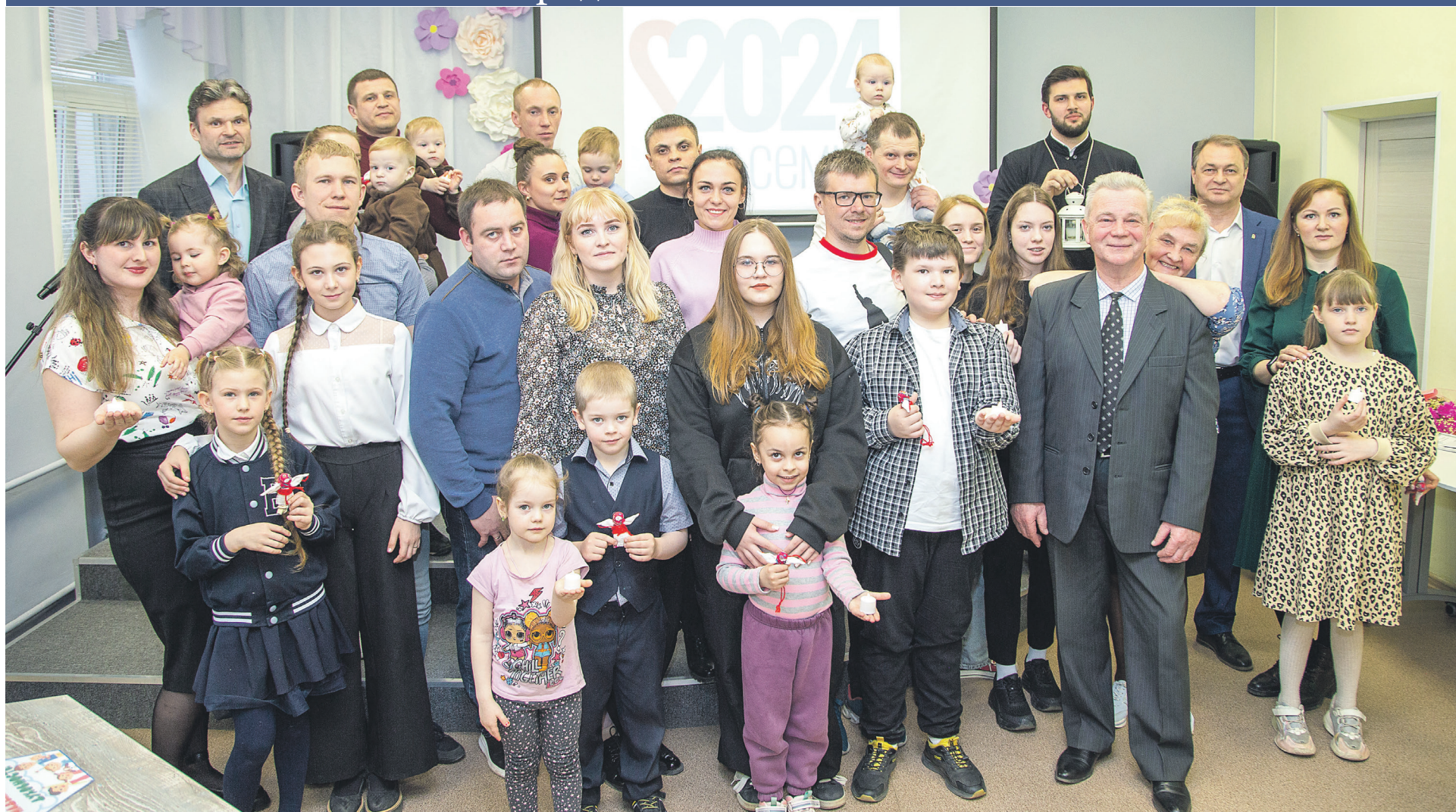
На торжественном мероприятии в модельной библиотеке.