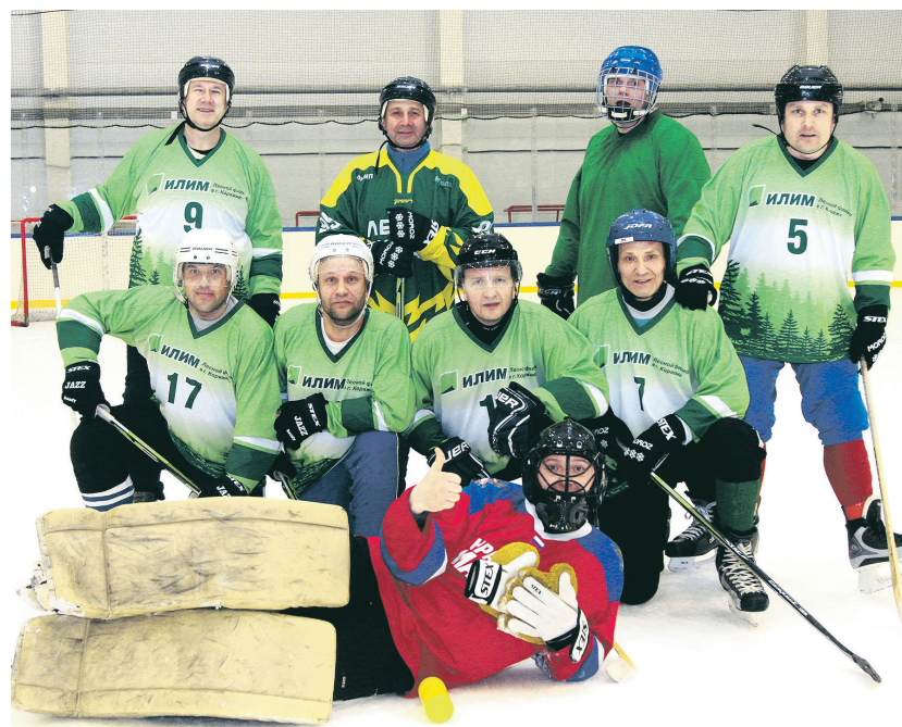
Победитель турнира – команда Лесного филиала

Больше месяца на льду «Илим-Арены» шел турнир по ринк-бэнди в зачет 35-й спартакиады «Илима». Накануне стали известны победители и призеры этих массовых соревнований