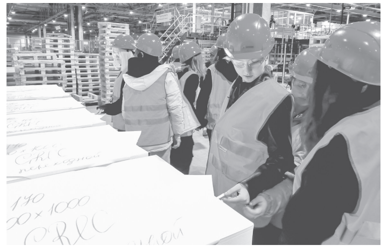
Белые бумаги – гордость ЦБК в Коряжме

Возможность познакомиться с целлюлозно-бумажным комбинатом в Коряжме восьмиклассникам предоставил Всероссийский проект «Первые в профессии». Профоринтационные мероприятия для школьников от 14 до 18 лет с этого года проходят во всех субъектах России. Цель экскурсий – познакомить ребят