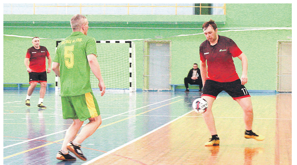
Борьбу на площадке ведут футболисты ПСБЦиПБ и управления