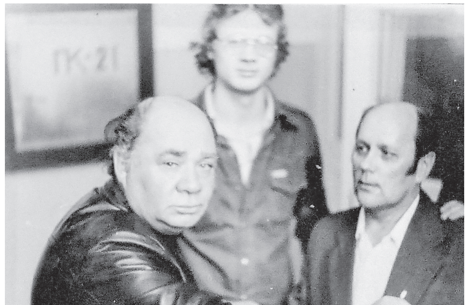
На встрече с Евгением Леоновым

Люди старшего поколения хорошо помнят аттракционы в Парке культу-