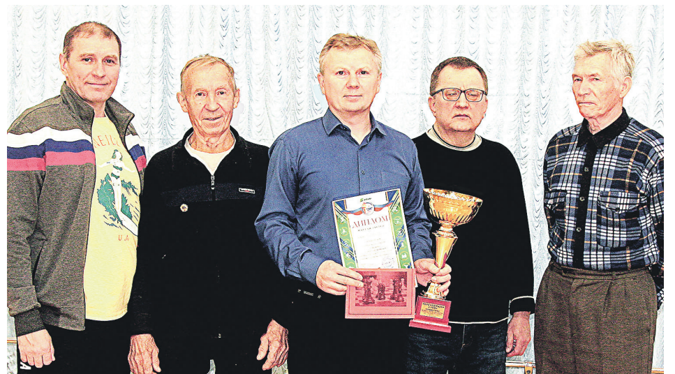
Команда ПСБЦиПБ – победитель шахматного турнира спартакиады