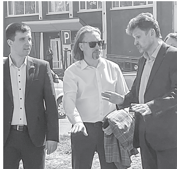
Гости оценили скейт-площадку МКЦ «Родина»

Молодёжные и спортивные площадки должны работать эффективно. К такому мнению пришли депутаты областного Собрания в ходе визита на юг региона. А вот каким способом привлекать молодежь – обсудили на пленарном заседании Координационного совета вместе с коллегами из муниципалитетов