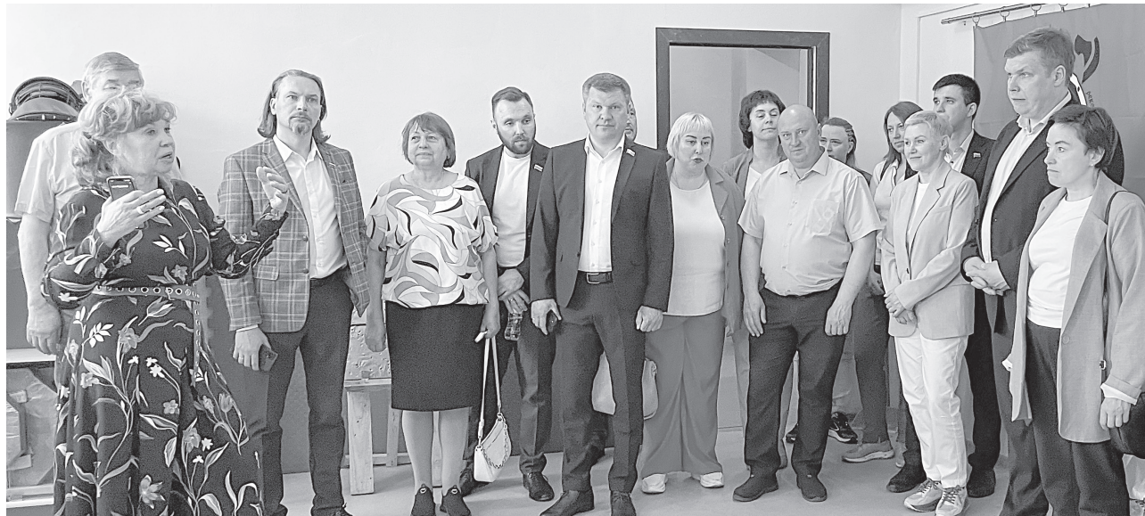
Областные депутаты посетили центр «Патриот»