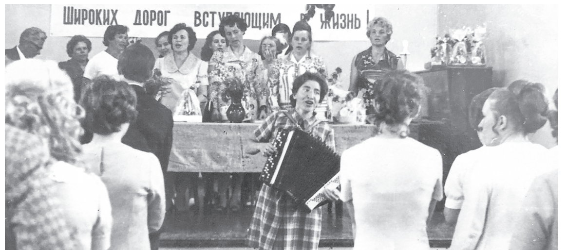
На торжественной части выпускного вечера