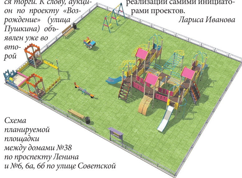
Схема планируемой площадки между домами №38 по проспекту Ленина и №6, 6а, 6б по улице Советской