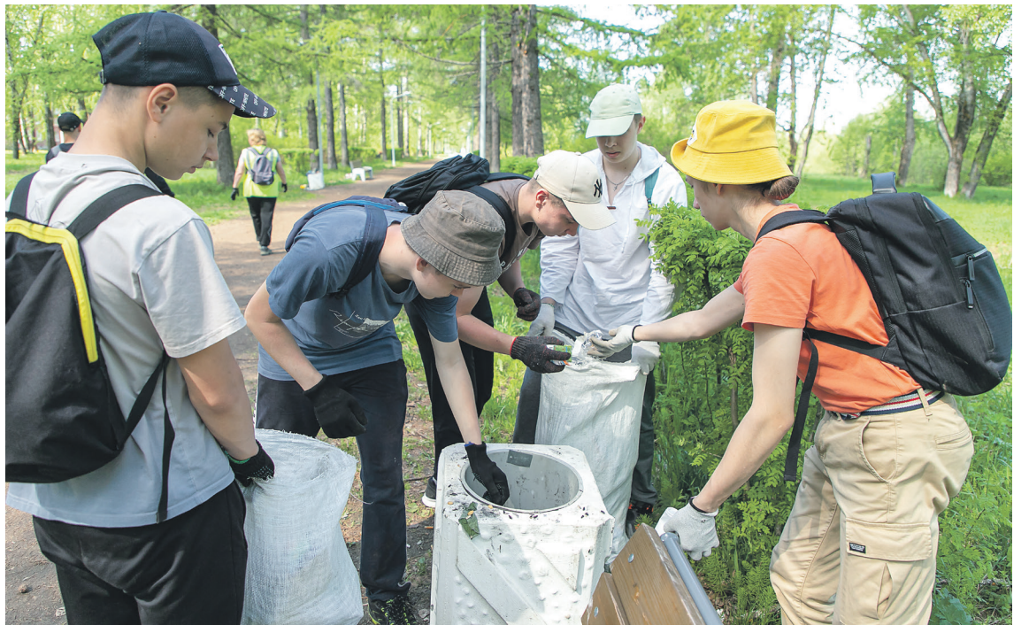
Трудовое лето юные коряжемцы начинают с уборки общественных территорий города

Отметим, средства на трудоустройство несовершеннолетних в каникулы выделены из