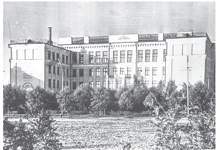
Школа №10, 1974 г. Счастливого пути!