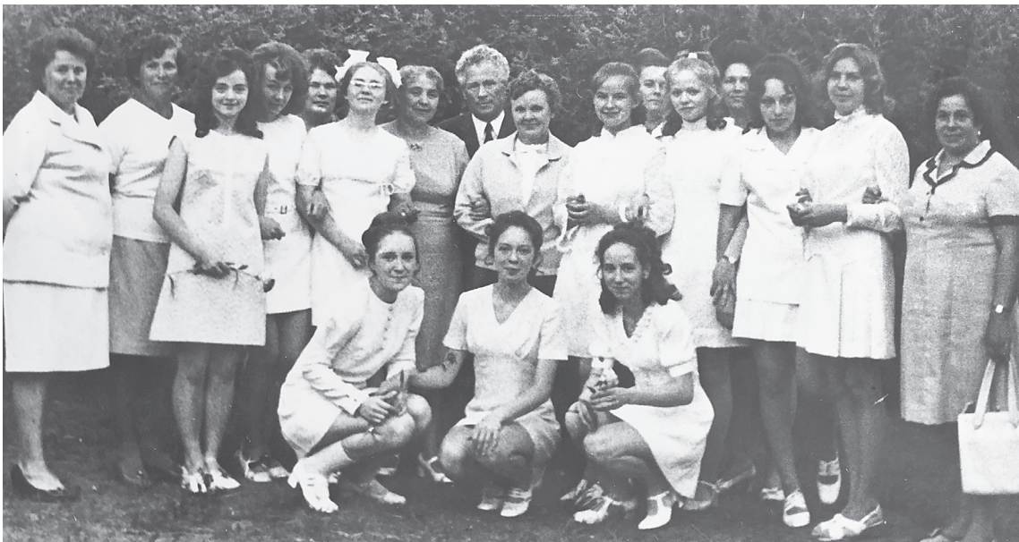
«Нам школьный сад ветвями машет». Выпускницы с учителями и родителями