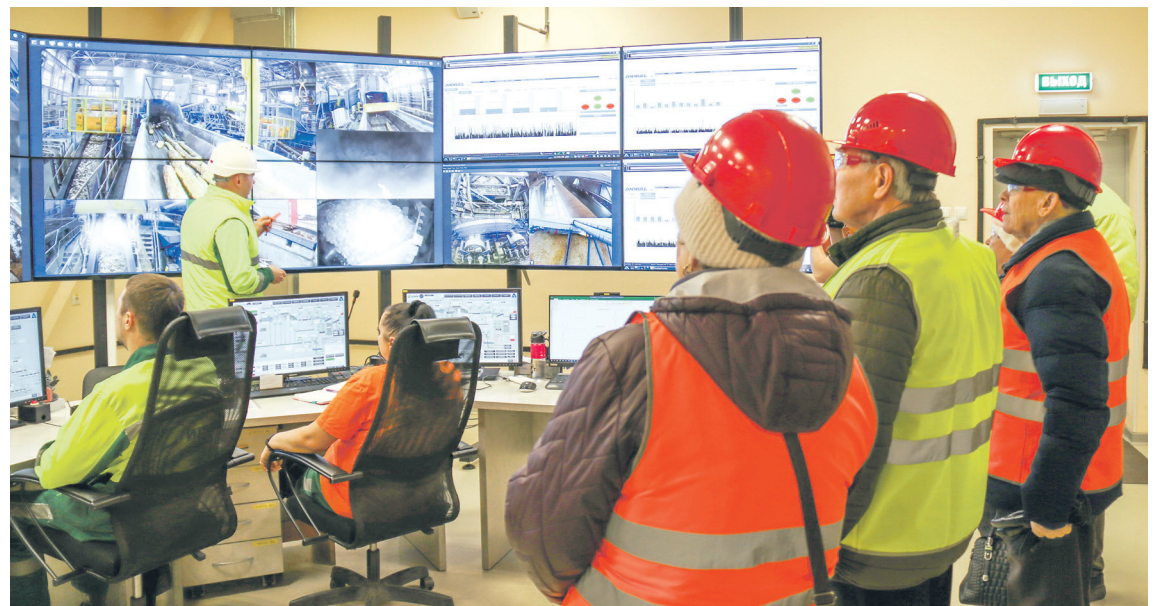
Ветераны ОГС на щите управления участка рубки хвойной и лиственной щепы