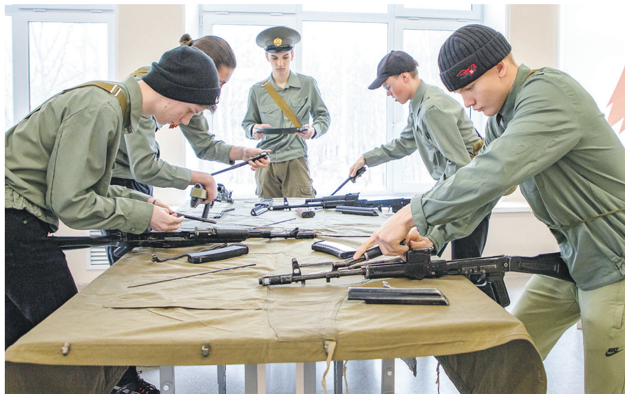
Команда школы №3 проходит этап сборки-разборки автомата

На базе зонального центра «Патриот» состоялся муниципальный этап Всероссийской военно-патриотической игры «Зарница 2.0». Ее участниками стали школьники шести образовательных учреждений Коряжмы в возрасте от 11 до 13 лет. Организатором выступило местное отделение «Движение Первых»