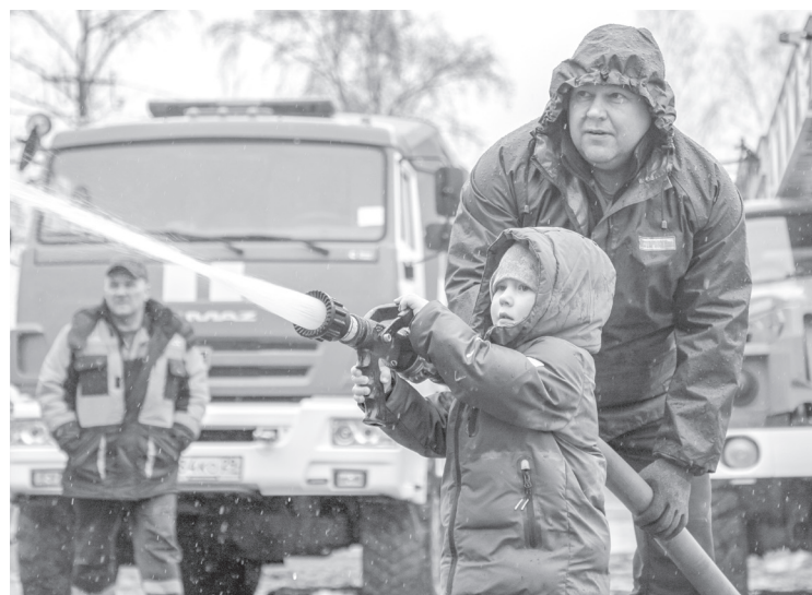
На детской площадке идет знакомство с профессией пожарного