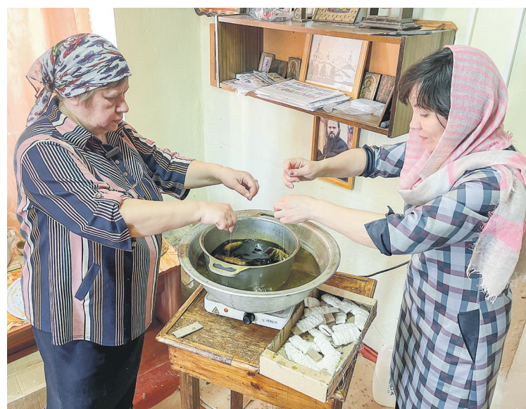
Процесс изготовления розжига