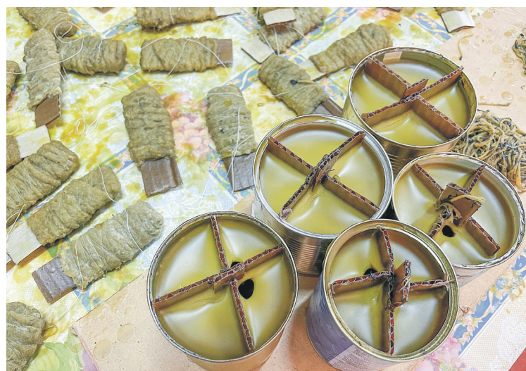
Готовые окопные свечи и розжиг