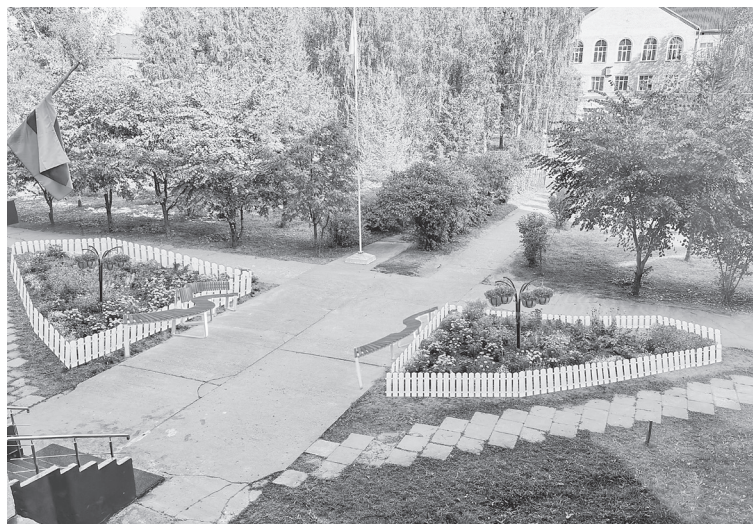
Скамейки и огороженные клумбы добавят уюта (слайд из презентации)

Инициативные родители учеников школы №3 впервые решились на участие в областном проекте «Комфортное Поморье». Что хотелось бы видеть детям и взрослым на пришкольном дворе? Какие варианты благоустройства территории рассматриваются? Об этом инициативная группа рассказала в ходе презентации