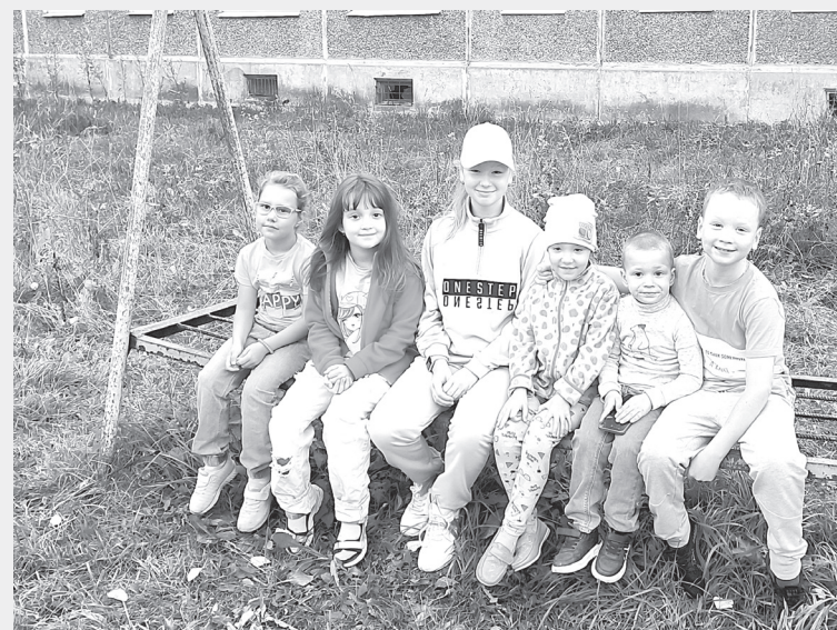
Детвора – в ожидании перемен

Подробную информацию можно узнать на сайте проекта или в официальном сообществе «Комфортное Поморье» «ВКонтакте».