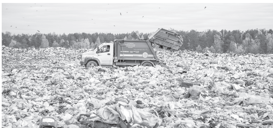
СЛАЙД ИЗ ПРЕЗЕНТАЦИИ ПРОЕКТА МУСОРОСОРТИРОВОЧНОГО КОМПЛЕКСА В КОРЯЖМЕ