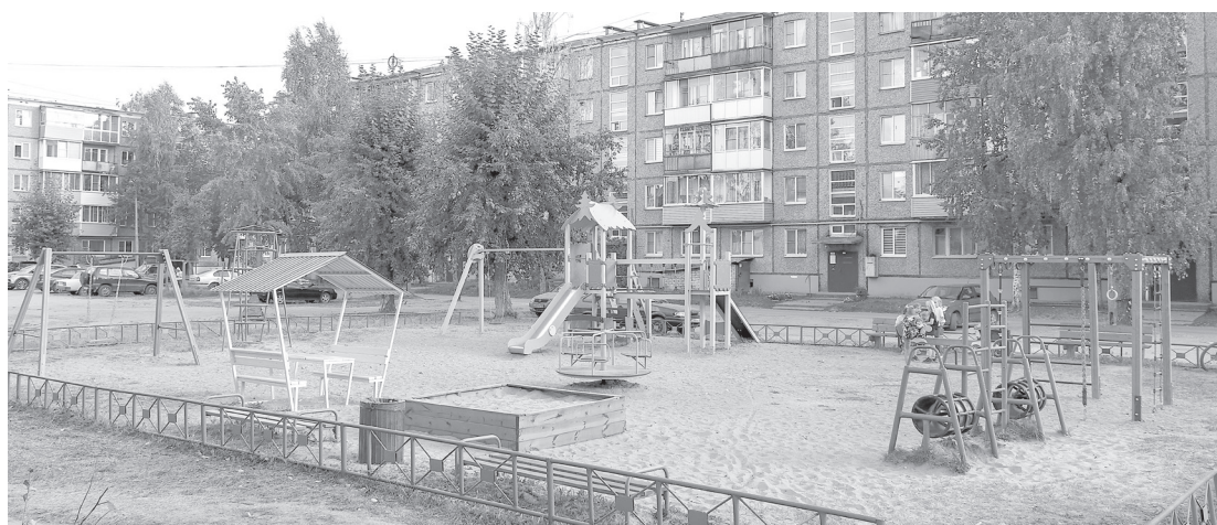
Завершено обустройство детской игровой площадки во дворе домов 10 и 12а на пр. Ломоносова

Жильцы соседних домов разделяют желание инициативной группы преобразить дворовую территорию. Эту идею они уже обсудили ранее на собраниях и в общем чате, созданном для оперативного информирования. Накануне вечером на презентации проекта все единогласно проголосовали за грядущие изменения. С наименьшим энтузиазмом люди готовы выйти на субботник, когда придет время оказать помощь в реализации проекта.