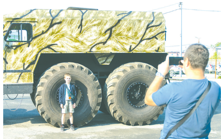
Наибольший интерес у детей и взрослых вызвал отечественный вездеход «Хищник»